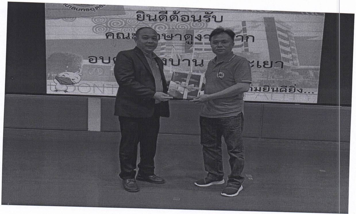
มอบของที่ระลึก