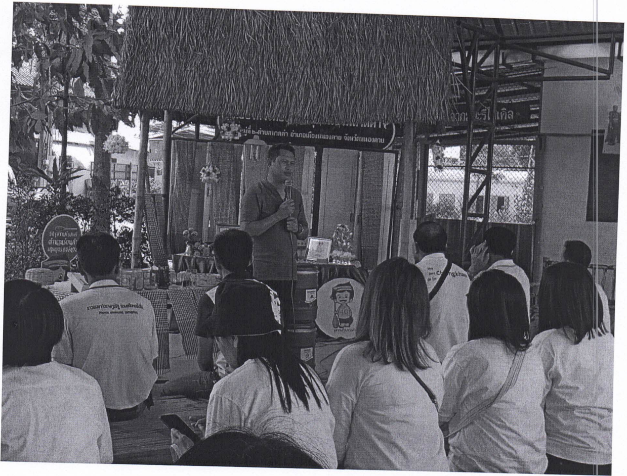
วิทยากรวันที่ ๑๓ มกราคม ๒๕๖๓