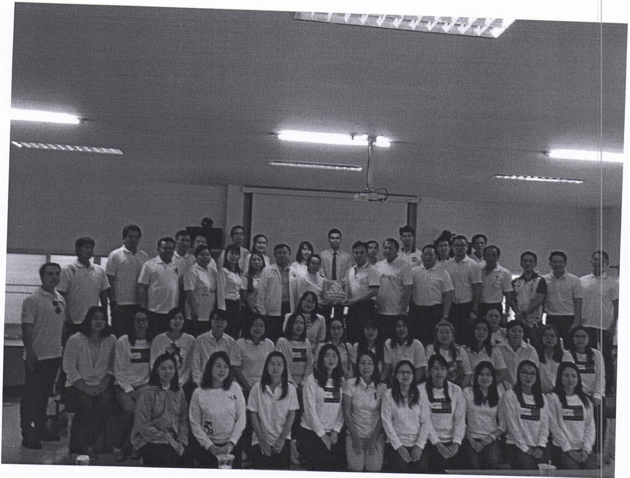
มอบของที่ระลึก